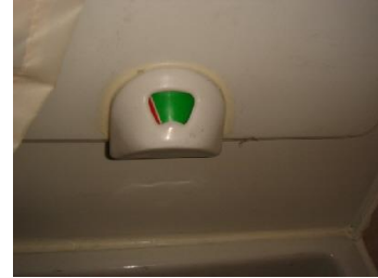
汚物タンクメーター

※ご返却後の汚物処理は当店で行います。ただし、 レンタル期間が長期にわたる場合やカセットがいっぱいになった場合には、以下の手順でお客様に汚物処理をして頂く必要があります。