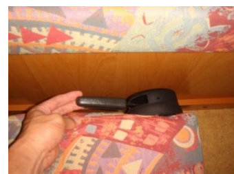
リクライニングレバーをひいてリクライニングします。