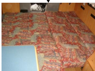
フロアベッドの完成です！