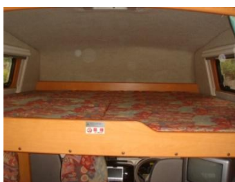
バンクベッドを引き出して、マットを展開します。