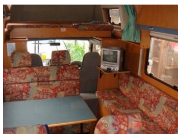
展開していない状態のダイネットです。