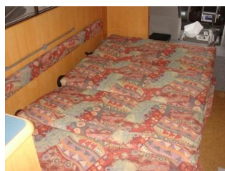
同様に前後をフルフラットの状態にします。