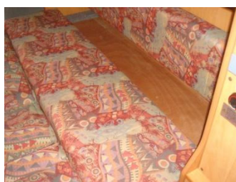
ベンチシートの座面をずらして背もたれを隙間に埋めます。