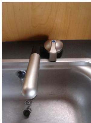
給水タンクからの水栓