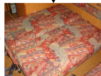
フラットの状態にします。