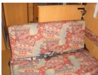
背もたれをはずします。