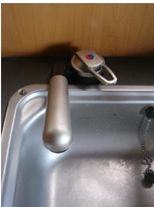
清水タンクからの水栓